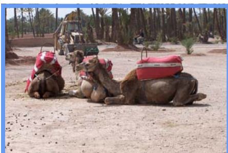
Un repos bien mérité. 27/06/08.