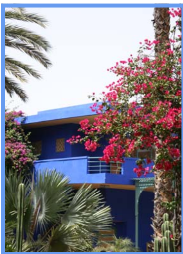
Le jardin Majorelle Marrakech - 25/06/08.