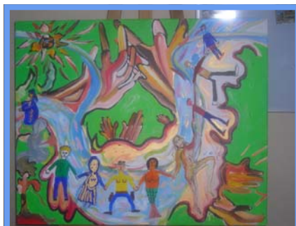
Luth en cœur—Peinture collective réalisée dans le cadre du concours de peinture inter-GEM, à l'échelle nationale.