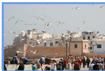
Essaouira - 26/06/08.