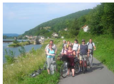
Sortie vélo - 27/07/09.