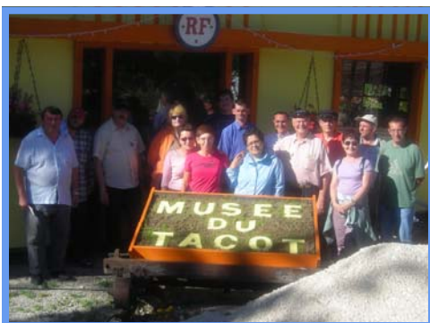
Cléron - 03/08/09.