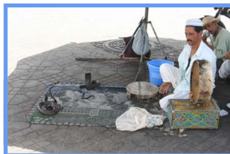
Sur la place Jemaa el Fna - 28/06/08.