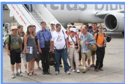
Le retour, déjà!!! Marrakech - 30/06/08.