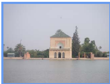
La Ménara Marrakech - 25/06/08.