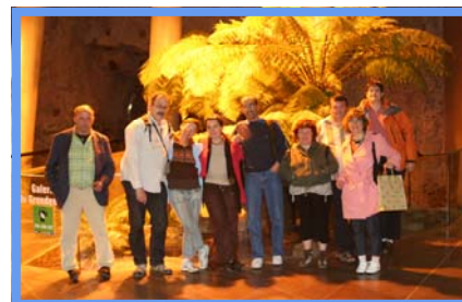
A Vulcania - 20/08/09.