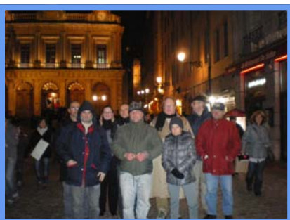
Fête des lumières-Lyon-11/12/2010.