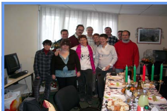
Repas de Noël - 19/12/2010.