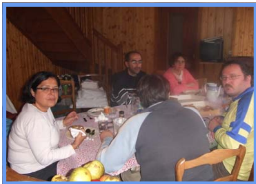
WE Longeville - 16, 17 et 18/10/2010.