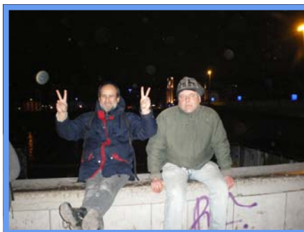
Fête des lumières-Lyon-11/12/2010.