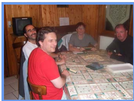
WE Longeville - 16, 17 et 18/10/2010.