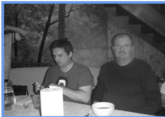
WE Longeville - 16, 17 et 18/10/2010.