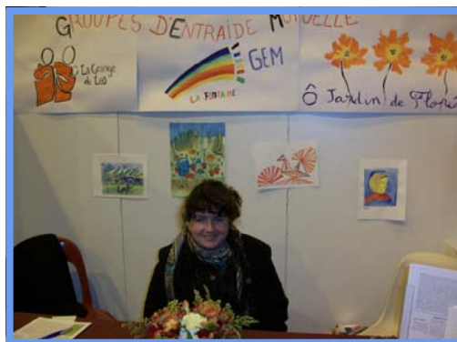
Forum du handicap - 18/11/2010.